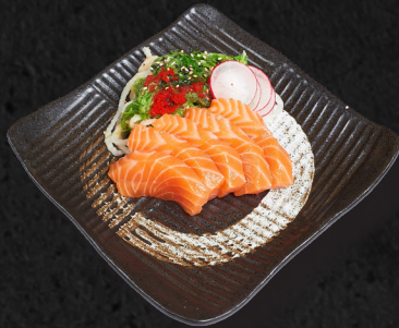
T1. LACHS SASHIMI

Das Sashimi wird mit frischem Rettich, Algensalat und einem Sesamdressing angerichtet