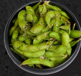
02. CRAZY EDAMAME 4,90 € Gedämpfte Sojabohnen, mit Meersalz und geröstetem Sesam