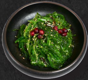
01. GOMA WAKAME 4,50 € Seetang-Salat, mit Granatapfel und geröstetem Sesam

Share and Care, perfekt um mit den Liebsten zu teilen