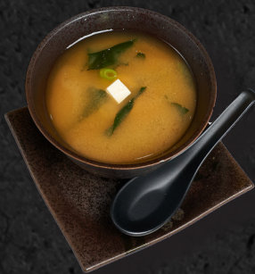
13. MISO SOUP 4,20 €

Avocado mit knusprigem Mantel, dazu Konichi-Soße