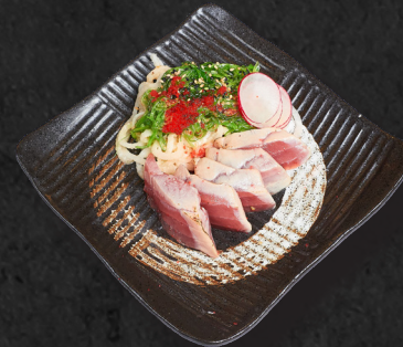
T6. THUNFISCH TATAKI

5 Scheiben leicht flambiert, Wasabiwurzel