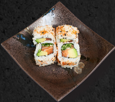
U3. HOT ALASKA