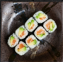
M11. SAKE AVOCADO