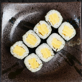
M5. TAMAGO MAKI