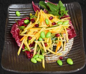
09. JUICY MANGO 4,90 €

Share and Care, perfekt um mit den Liebsten zu teilen