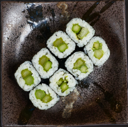
M7. ASUPARA MAKI

Für einen Aufpreis von 2,- Euro können Makis frittiert werden