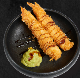
08. EBI FRY (2STK.) 4,90 € Garnele im Tempura-Mantel mit Sweet-Chili Soße