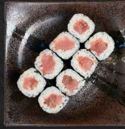
M2. MAGURO MAKI