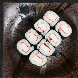
M6. KANI MAKI