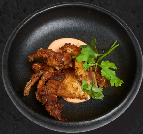
11. SOFT CRAB 6,90 €

Süßkartoffel-Fried mit italienischen Kräutern, dazu Konichi-Soße