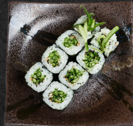
M4. KAPPA MAKI