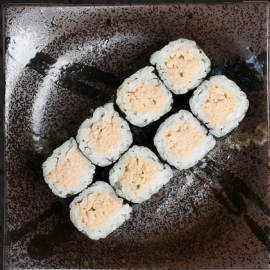
M9. TUNA MOUSSE MAKI