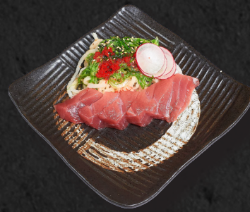
T2. THUNFISCH SASHIMI