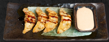
06. CHICKEN DUMPLING (4STK.) 5,20 € Teigtaschen gefüllt mit Hähnchen und Gemüse, dazu Teriyaki & Chilimayo Dip