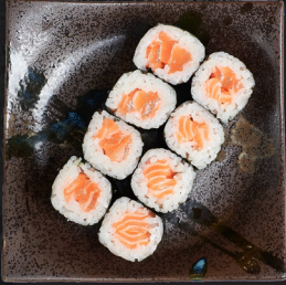
M1. SAKE MAKI

Es werden je 8 Stück pro Portion serviert