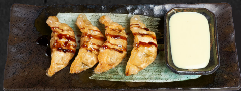
05. TOFU DUMPLINGS (4STK.) 4,90 € Teigtaschen gefüllt mit Tofu und Gemüse, dazu Teriyaki und Konichi-Soße