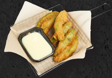
12. AVOCADO STICKS 5,50 €

Weichschalen Krebs in Tempura-Mantel, Koriander und Chilimayo