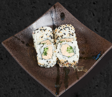
U5. TUNA URAMAKI

Thunfisch Mousse, Schnittlauch, Gurke, Sesam