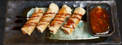
04. PRAWN ROLLS (4STK.) 5,20 € Garnelenfüllung in knusprigem Reispapier, dazu Teriyaki & Sweet-Chili Soße