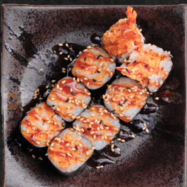
M15. EBI FRY