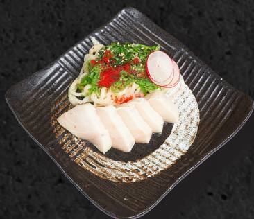
T7. BUTTERFISCH TATAKI

5 Scheiben leicht flambiert, Schnittlauch, Konichi-Soße