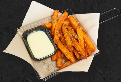
10. SWEET PATATE 5,50 €

Frischer Mangosalat, mit Gurke, Karotten, Edamame-Kerne und Granatapfel