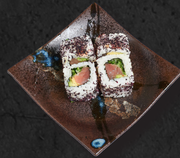
U4. TUNA CLASSIC