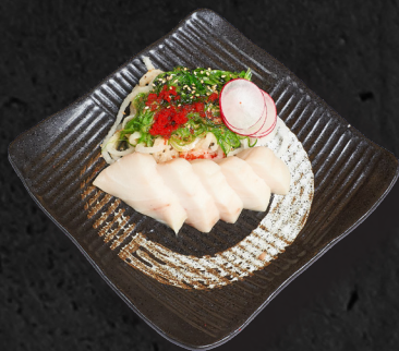
T3. BUTTERFISCH SASHIMI