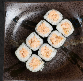
M10. BBQ SALMON MAKI