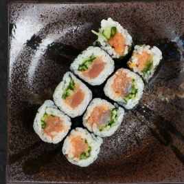
M8. SPICY TUNA MAKI