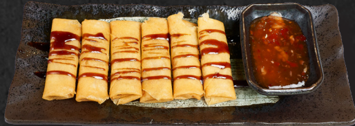
03. SPRING ROLLS (6STK.) 4,50 € Gemüsefüllung in knusprigem Teigblatt, dazu Teriyaki & Sweet-Chili Soße