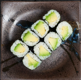
M3. AVOCADO MAKI