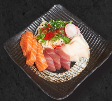
T4. SASHIMI MIX