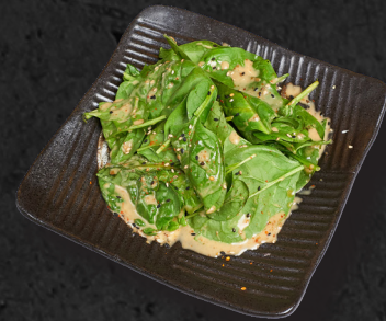
14. BABYLEAVES 4,50 €

Eine warme japanische Suppe, aus fermentierter Sojapaste, mit Seidentofu, Algen und Frühlingszwiebel