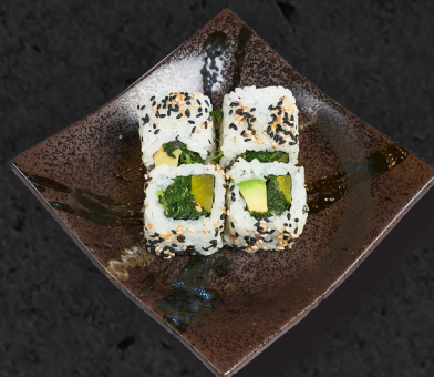
U6. VEGGIE URAMAKI