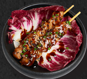
07. BBQ CHICKEN 4,90 € Gegrillte Hähnchenspieße in Mirin Sojasoße mariniert, dazu gerösteter Sesam & Schnittlauch