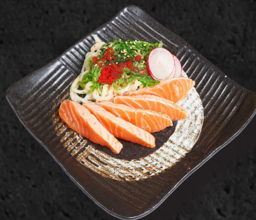
T5. LACHS TATAKI

5 Scheiben leichtflambierte Togarashi, Chilimayo